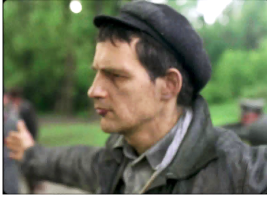
Görsel 3. Saul'un Oğlu filminden bir kare

Nemes, belgeselci selefleri Claude Lanzmann ve Marcel Ophuls gibi, en yürek parçalayıcı genel görüntülerin bile, mesafelerinden dolayı bir tür rahatlama sağladığının farkındadır (Ratner, 2016, s. 58). Bu nedenle yönetmen, herkesin bildiği ve tehlikeli bir şekilde aşinalaştığı vahşeti yine herkesin aşına olduğu klişeleşmiş imgelerle yeniden yaratmak yerine oğluna son görevini yerine getirmeye çalışan bir babanın çabasına ve dramına odaklanır. Başka cesetleri ortadan kaldırırken neredeyse robotlaşmış hareketlerde bulunun babanın, oğluna ait olduğunu sandığı ceset karşısındaki tutumu ve bu tutumun insana dair sordurduğu sorular zaten yeterince fazla şey söylemektedir. O nedenle herkesçe bilinen ve temsil edilmesi bu nedenle de sorunlu olan eylemler hep net odağın dışındadır.