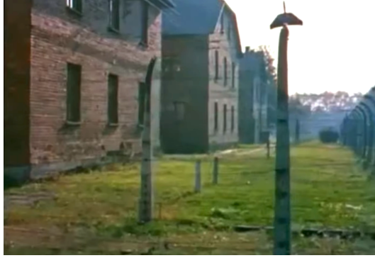
Görsel 1. Gece ve Sis filminden bir kare

düşünmeyi olanaklı hale getirmeyi dener. Elde edilen uzaklık paradoksal olarak bize gösterilenlerin korkunç doğasının giderek bilincine varmamızı sağlar: Korkuyla uyuşmak yerine izleyicinin düşünebilmesi, tahayyül edebilmesi ve anlayabilmesi için alan ve özgürlük sağlanır. İnsan burada yarım saatlik bir belgesel içinde araçların ve etkilerin karmaşıklığıyla (özellikle Riefenstahl ile karşılaştırıldığında) çarpılır. Müzik etkiyi artırıcı olmak yerine kontrpuan olarak kullanılır; benzer biçimde soğuk, özlü anlatı sürekli olarak görüntülerin etkisine (etkilerini azaltmaksızın) kontrpuan oluşturur. Bütün film aracı (film) öne çıkararak biçimsel değişimlerin karmaşık modeli üzerine kurulur, öyle ki hakikilik duygusu sürekli olarak filmin dilinin bilincinde olmakla koşutluk içindedir: Şimdi / geçmiş, renkli / siyah-beyaz, hareketli görüntü / fotoğraflar, stilize kamera hareketi / otantik haber filmi. Gördüklerimiz üzerine düşünmek için -belki bir noktaya kadar- cesaretlendiriliriz (Wood, 2008, s. 225-226).