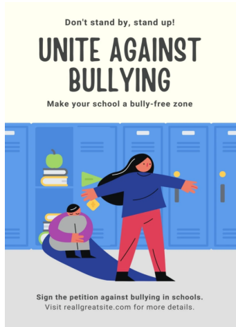
Görsel 1. Don't stand by, stand up! (Houston ISD, 2022, 17 Ekim)

Bu çalışmada analiz edilen afişler, görsel öğeler (resimler, renkler, afişler), sözel içerik (sloganlar, bilgilendirici ifadeler) ve sembolik anlamlar (figürler, simgeler, ikonlar) üzerinden incelenmiştir. Akran zorbalığıyla ilgili afişlerde kullanılan görseller, metinler ve renkler, izleyicilere değişik anlamlar aktarabilir. Bu çalışmada Roland Barthes'ın göstergebilim yaklaşımı, kuramsal çerçeveyi oluşturmaktadır. Göstergelerin nasıl anlam kazandığını ve nasıl yorumlandığını inceleyen Barthes'a göre göstergeler, iki katmanlı bir yapıya sahiptir. Düz anlam ve yan anlam, gösterenin gerçekte neyi temsil ettiği ile kültürel ve ideolojik bağlamda taşıdığı ek ve dolaylı anlamları vurgulamaktadır (Erdoğan, 2010, s. 154).