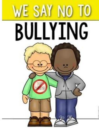
Görsel 2. We say no to bullying (TPT, ____)

Görsel 2'deki afişin üst hizasında “Zorbalığa hayır diyoruz” sloganı yer almaktadır. Bu slogan, görselin ana mesajını açıkça ifade etmektedir. Zorbalığa karşı sessiz kalmamız ve bu soruna karşı birlikte mücadele etmemiz gerektiğini vurgulamaktadır. Slogan sadece iki çocuğun değil, tüm akranların mesajını yansıtmaktadır. Basit tipografi, mesajın geniş kitlelere ulaşmasını sağlamaktadır. Sloganın altında yer alan iki çocuk ayakta ve yan yanadır. Çocukların biri beyaz tenli ve gözlüklü, diğeri ise siyah tenlidir. Siyah tenli çocuk sağ kolunu beyaz tenli çocuğun omzuna atmış, beyaz çocuk ise sol koluyla siyah çocuğu sırtından kavramış durumdadır. Gülümseyen çocuklardan soldakinin üzerindeki yeşil tişörtte “Zorbalığa hayır” yazmaktadır. Yeşil renk, umut ve yeni başlangıçları; diğ er çocuğun üzerindeki kıyafetin rengi olan gri ise, tarafsızlık ve dengeyi temsil etmektedir.